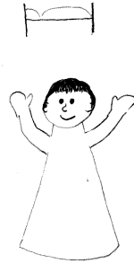
Nemocní jsou uzdraveni